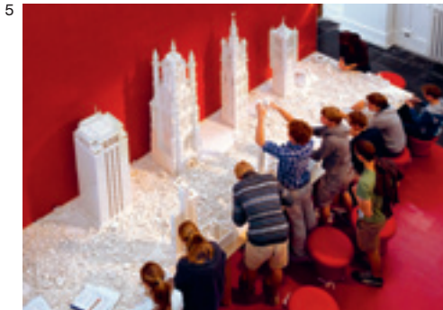
< zicht op het STAM, 2011